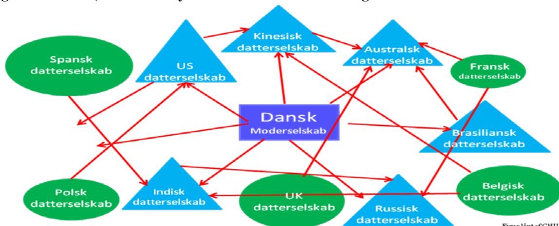
Figur 3: Koncern, der ikke benytter bindende virksomhedsregler

Fordelen ved at benytte bindende virksomhedsregler er, at der ikke skal tilvejebringes fornødne garantier, hver gang en koncernvirksomhed i EU ønsker at overføre oplysninger til en koncernvirksomhed uden for EU (se figur 3 til illustration).